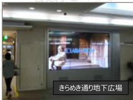
きらめき通り地下広場