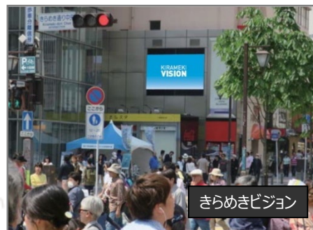
きらめきビジョン